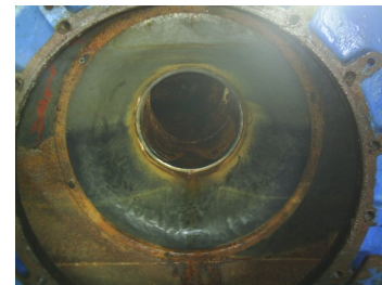
Tapa Espejo de Bomba pesquera recubierta con RELLENO METALICO - RELLENON